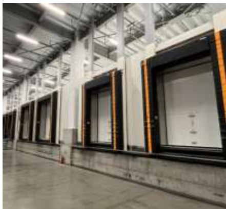
▲ひとまいるロジスティクス冷凍冷蔵設備

現在、外食業界においては、配送ドライバー不足やコスト高騰、2024年問題への対応、そして食材の厳格な品質管理が共通の大きな課題となっています。ひとまいるロジスティクスでは、グループ内配送で培った圧倒的なアセットと配送ノウハウを活用し、これらの物流課題を解決する高効率な3PL体制を構築。セントラルキッチンからの集荷、一時保管、店舗への配送までのプロセスを一括して請け負います。表面を微凍結させる絶妙な温度管理が可能なパーシャル温度帯から、冷蔵、常温管理まで、食材に合わせた最適な温度管理を維持したまま、「焼肉トラジ」等各店舗へ配送。これにより、トラジ様の物流管理体制の効率化や、安定した店舗配送基盤の構築を実現いたします。