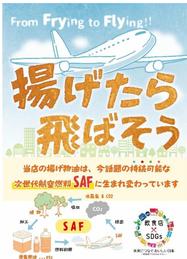
▲揚げたら、飛ばそう ポスター