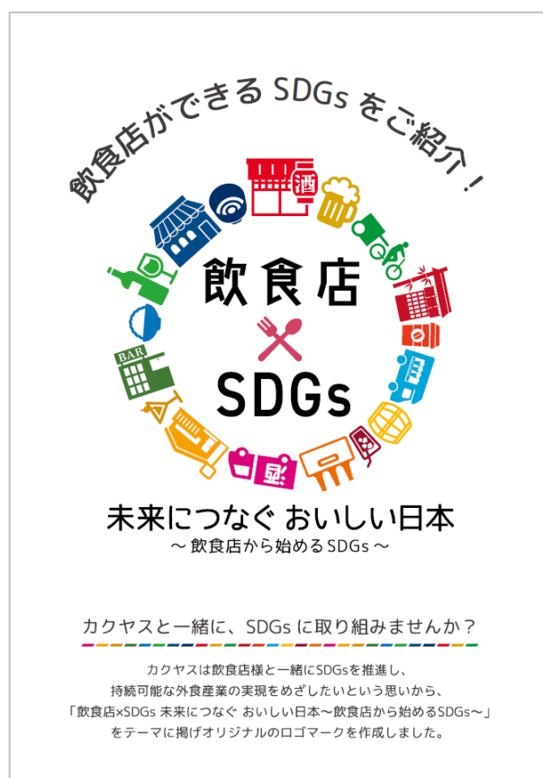
▲飲食店ができる SDGs 紹介冊子